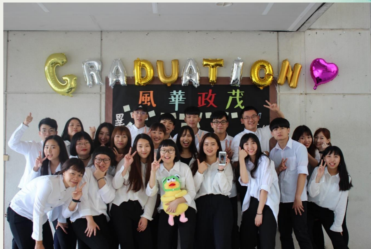
十八屆、十九屆與二十屆。