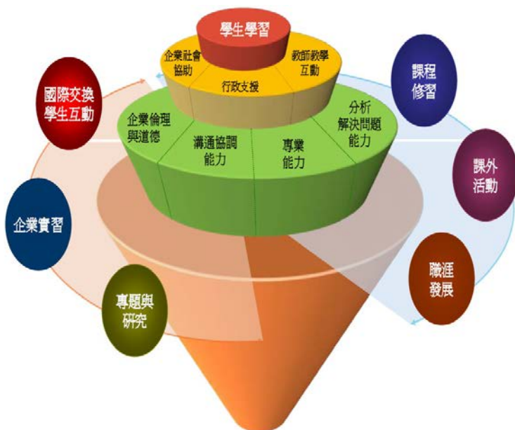
【以學生學習為中心的教育環境】

管理學院以「創新」作為前進的動力，希冀在商管教育學界中以穩健踏實的脚步長期耕耘，結合各界資源與社會網絡，盡心栽培未來的產業菁英與產出卓越的研究成果，並增拓國際交流合作機會，持續向未來願景「前進亞洲、立足大中華」付出努力，成為亞洲數一數二的領袖級商管學院。